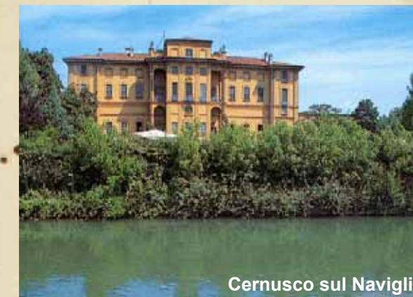
Cernusco sul Naviglio