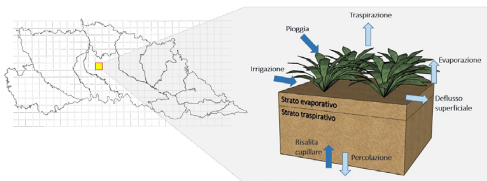
Figura 1 – Raffigurazione delle unità in cui viene suddiviso il territorio (sinistra) e del volume di controllo a cui si applica il bilancio idrologico (destra). Freccie blu indicano flussi in entrata al volume di controllo, frecce azzurre flussi in uscita.

Il modello IdrAgra 4 è un modello idrologico spazialmente distribuito che permette di simulare gli scambi di acqua nel sistema suolo-coltura-atmosfera di un determinato territorio, tenendo in considerazione la variabilità delle caratteristiche ambientali del territorio stesso. Per tale motivo, il territorio viene suddiviso da una griglia a maglie regolari in un numero di unità (celle) sufficientemente omogenee rispetto alle caratteristiche meteorologiche, pedologiche, di uso del suolo e di metodo irriguo (la dimensione di default delle celle è 250x250 m 2 ). Per ogni cella viene individuato un volume di controllo, che si estende dalla superficie del suolo sino alla profondità esplorata dagli apparati radicali delle colture, a cui si applica il bilancio idrologico (Figura 1).