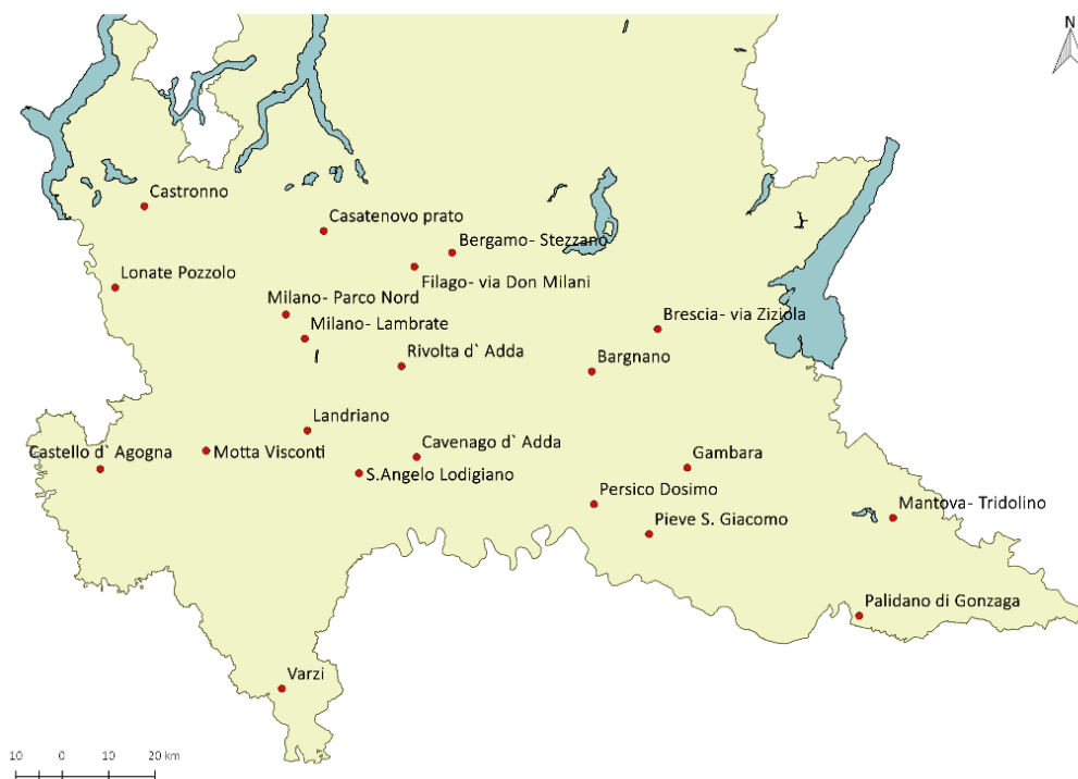
Figura 4 – Dislocazione delle stazioni selezionate nella pianura lombarda